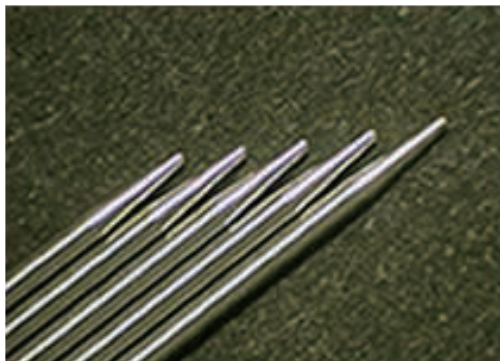
\phi 0.7 \cdot \theta 10^\circ \cdot 150\mu R