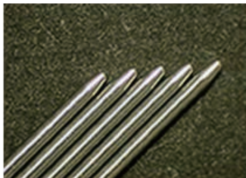
\phi 0.7 \cdot \theta 15^\circ \cdot 250\mu R